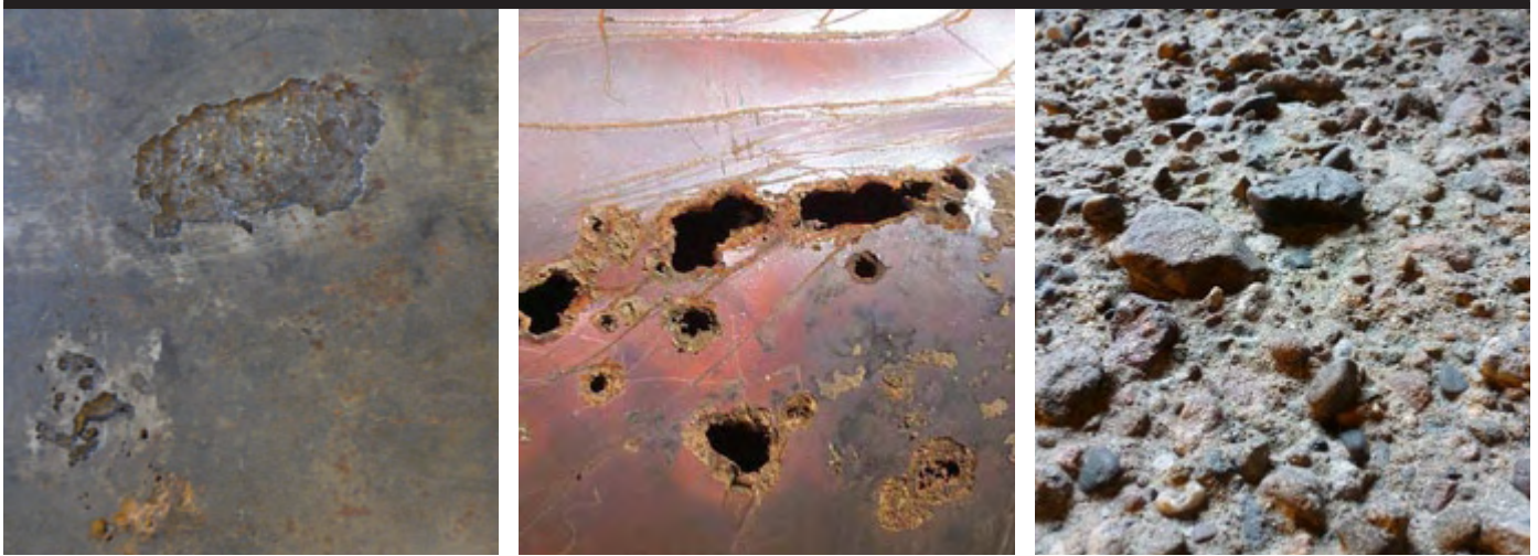
Fortgeschrittene Biokorrosion, Lochfraß und massive Betonauswaschungen; ausgelöst durch mikrobielle Stoffwechselfähigkeiten (Freisetzung von speziellen Enzymen sowie Schwefelwasserstoff)