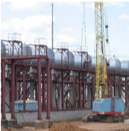
Erdöl-Separatoren, Innenbeschichtung gegen SRB-Bakterien

Eisenhaltige Metalle, die auf diese Weise korrodiert sind, haben auf der Oberfläche schwarze Flecken aus Eisen(II)sulfid. Werden diese Flecken entfernt, kommen anodische Vertiefungen mit blankem Eisen zum Vorschein, die durch rasantes Fortschreiten zu Lochfraß führen und extreme Schäden verursachen.