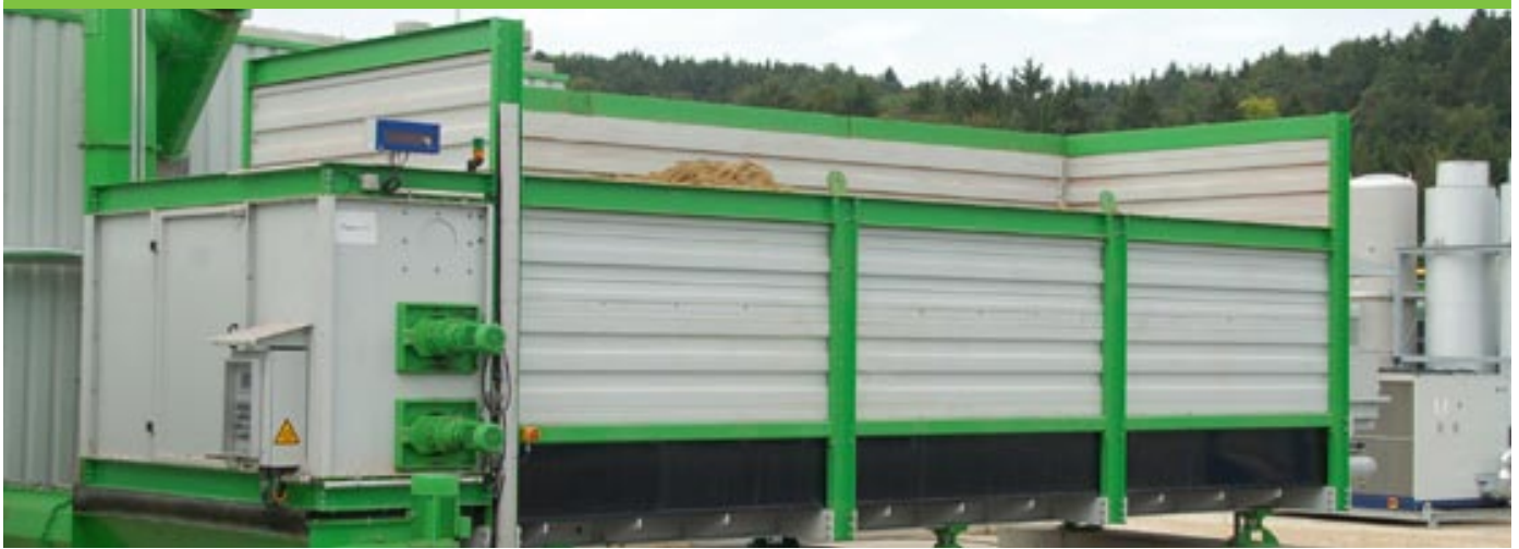
Abbildung: Schmack Biogas Komponenten GmbH