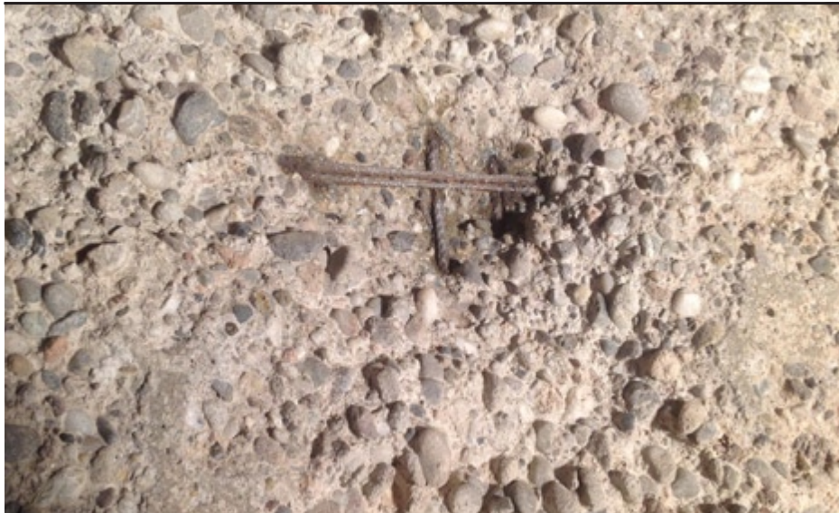
„Washed-out-concrete-effect“ - Erosión causada por los ácidos agresivos en el almacenaje