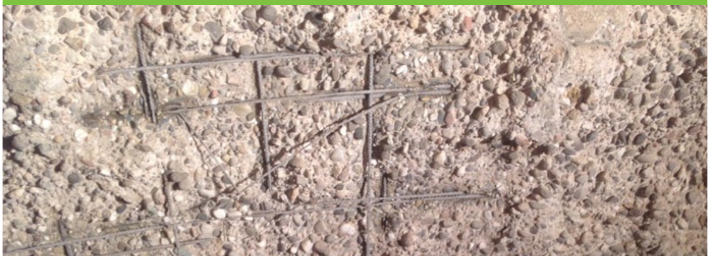
Erosión extrema, provocada por el ácido sulfúrico de origen biológico (BSA)

Heidelberg, Alemania: El silo de carga de una planta de biogás, presentaba grandes erosiones en el hormigón debido a gran ataque químico del material de fermentación. El sustrato del hormigón tuvo que ser restaurado con urgencia para garantizar la funcionalidad del tanque y evitar pérdidas desastrosas. Nuestro producto PROGUARD CN - 1M protege el hormigón de forma fiable contra el ataque químico.