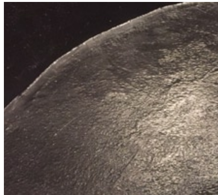
Pared y suelo recubiertos