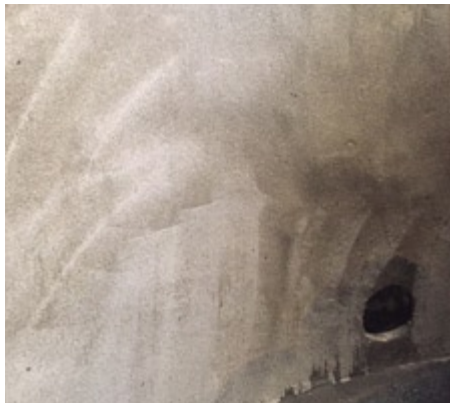
Pared imprimada, espolvoreada con arena de cuarzo