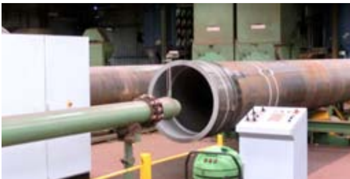
Recubrimiento interno de las tuberías de entrada

La embarcación es enorme; 488 m de largo, 75 m de ancho y 90 m de alto. Está anclada sobre el campo de gas „Prelude“, a 200 km de la costa de Australia. El buque extrae gas natural que es licuado a su salida. La capacidad de almacenamiento es de 600,000 toneladas métricas.