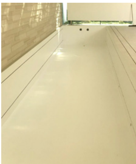
Материал покрытия наносили несколько более толстым слоем, чтобы обеспечить гладкость поверхности и достичь при этом повышения защитных свойств и эстетики.