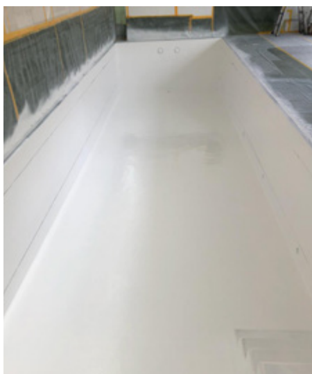
PROGUARD CN 200 белого цвета, как второй слой покрытия, придает бассейну красивый внешний вид.