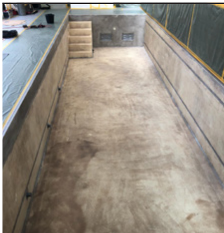
Грунтовка отшлифованного бетона продуктом CP-Synthofloor BETA 8016 и посыпка ее кварцевым песком.