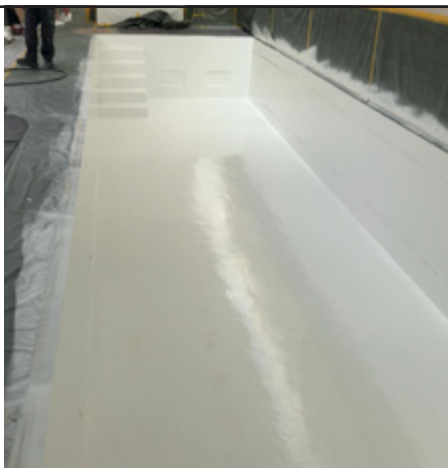
Нанесение первого слоя покрытия PROGUARD CN 200 светло-серого цвета методом безвоздушного распыления.